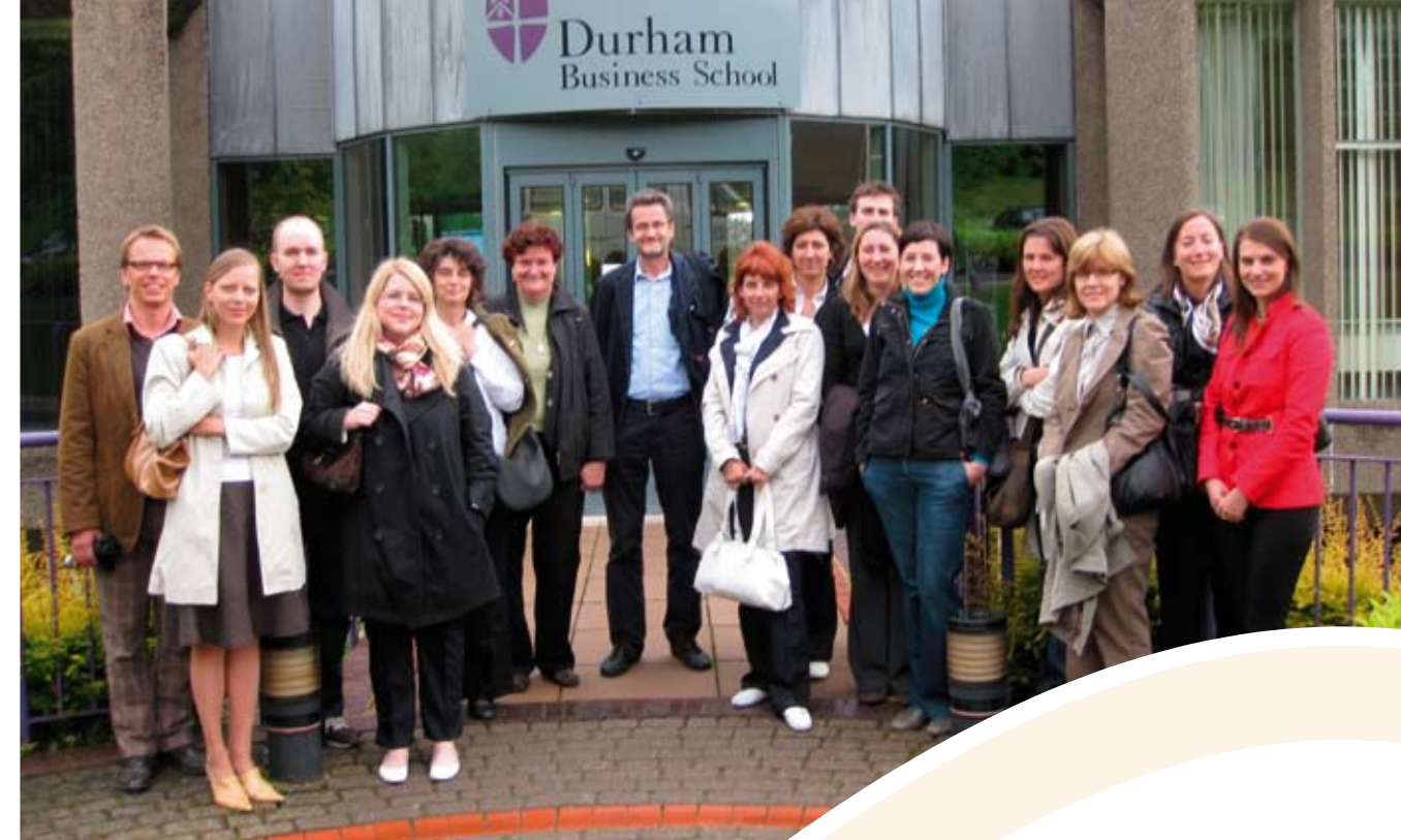
Doktorski seminar, Durham Business School, lipanj 2008., Durham, UK