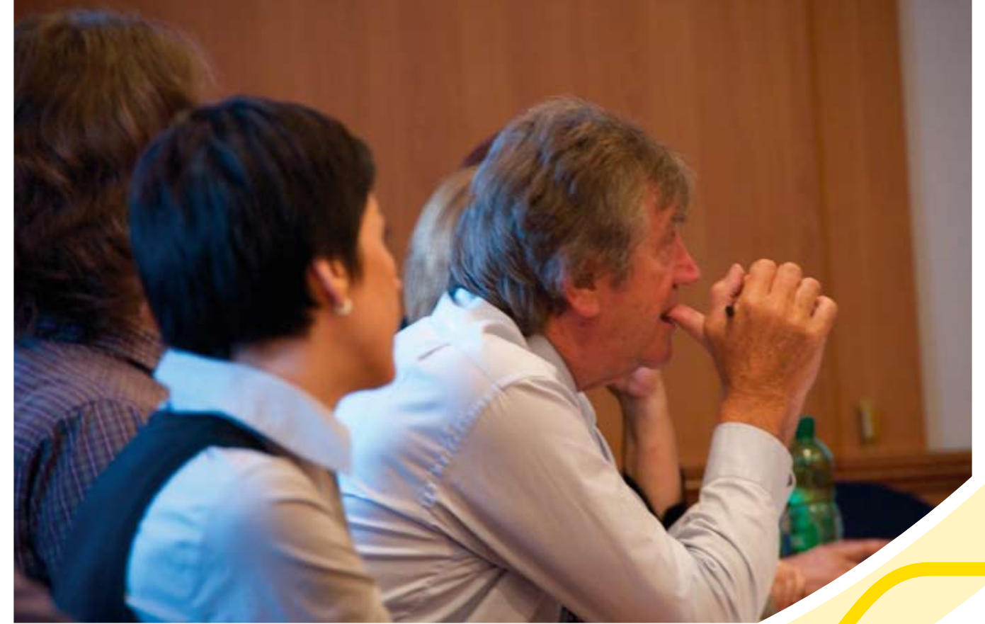
Prof.dr.sc. Allan Gibb

Tijekom trećeg semestra student ima tri obvezna i izborni kolegij(e) i/ili radionicu/seminar, kojima produbljava interdisciplinarni pristup poduzetništvu i inovativnosti (20 ECTS). U svakom semestru, student ima široku mogućnost izbora kolegija koji će doprinijeti profiliranju svakog kandidata prema individualnim istraživačkim interesima.