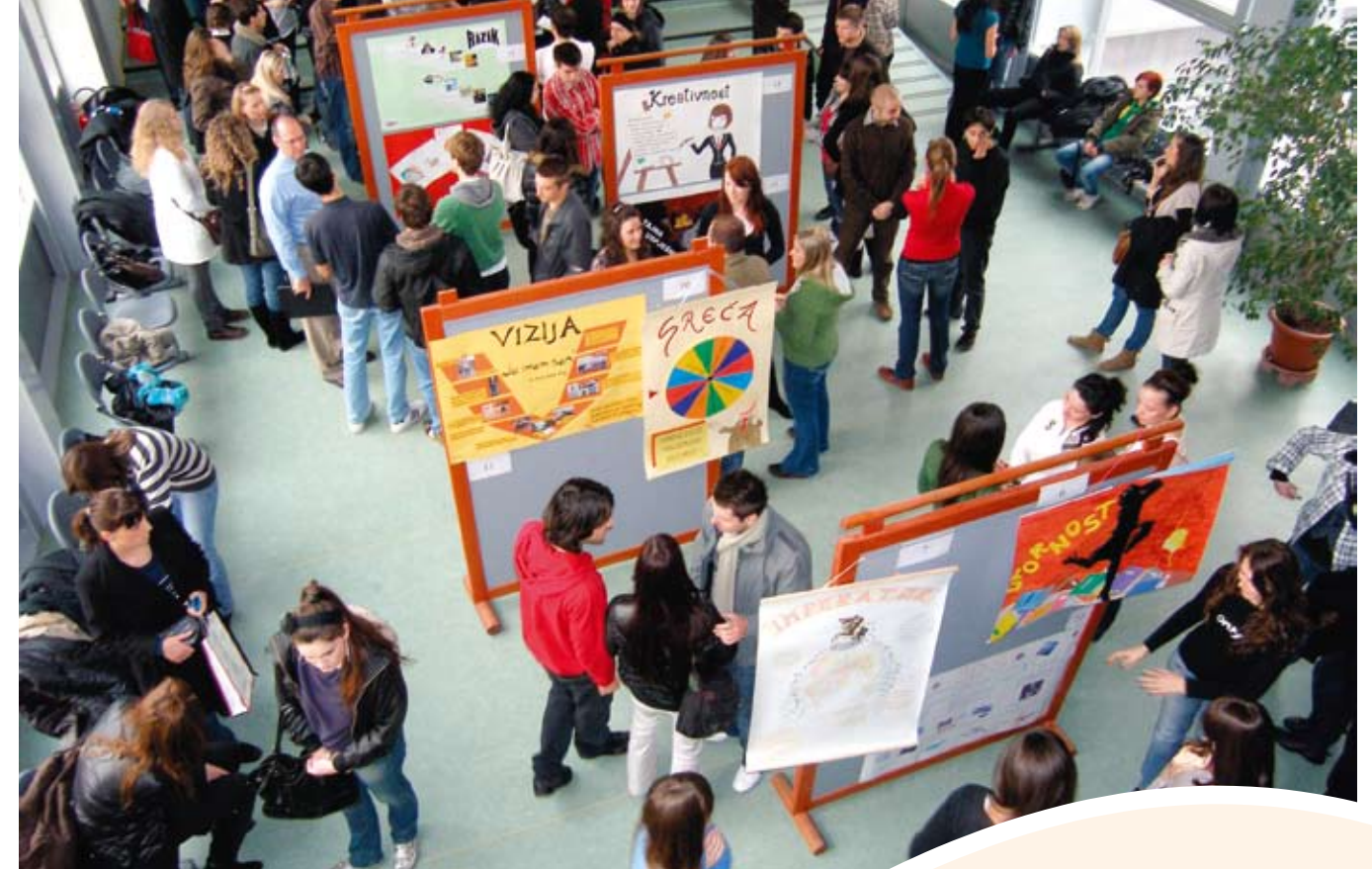
Globalni tjedan poduzetništva, 2010., Ekonomski fakultet u Osijeku

Studijski program iskazan je kroz ECTS bodove, što će omogućiti mobilnost polaznika studija, prijenos bodova, ili akumulaciju bodova u sustavu cjeloživotnog obrazovanja.