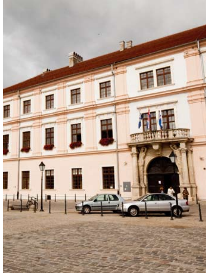
Ekonomski fakultet i rektorat Sveučilišta J.J. Strossmayera u Osijeku